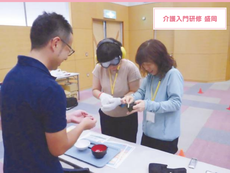
介護入門研修 盛岡