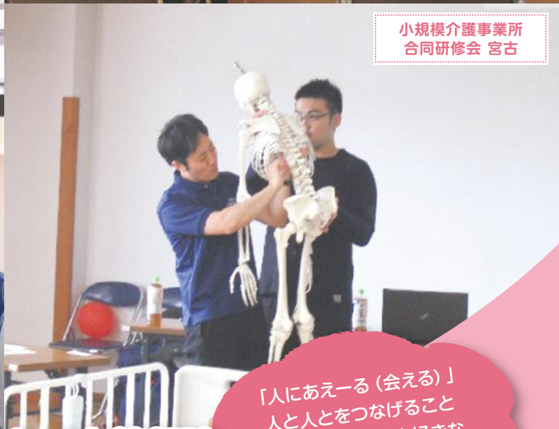
小規模介護事業所 合同研修会 宮古