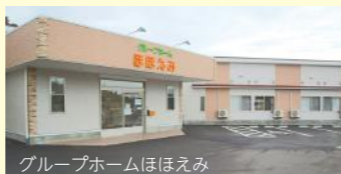
グループホームほほえみ

●定期的な親睦会(女子会や男子会…参加率は高い) ●永年勤続表彰(記念品・旅行等)5・10・15・20年