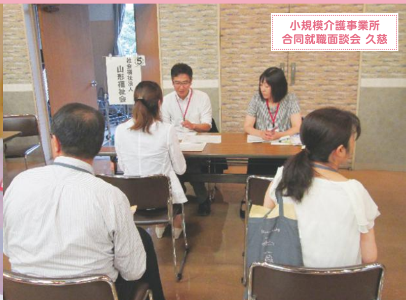
小規模介護事業所 合同就職面談会 久慈