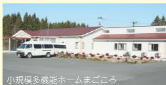
小規模多機能ホームまごころ

株式会社 海山会 岩手県九戸郡洋野町41-15-2 電話0194-65-6677 運営施設：平成24年4月20日 小規模多機能ホームまごころ 平成31年4月20日 グループホームほほえみ