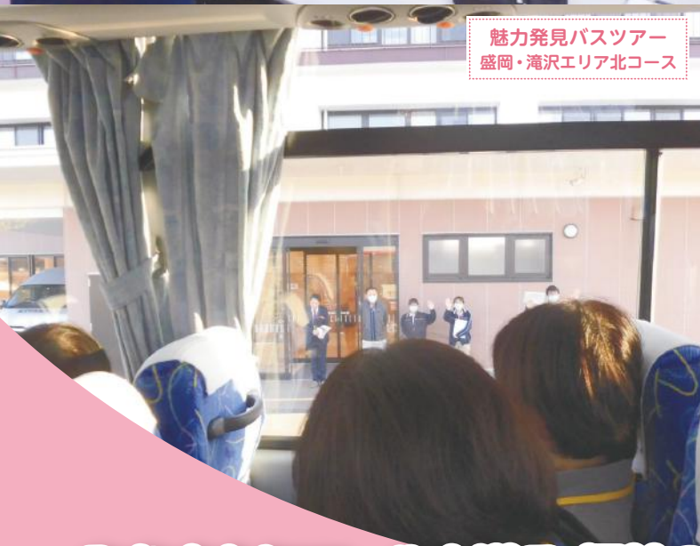
魅力発見バスツアー 盛岡・滝沢エリア北コース