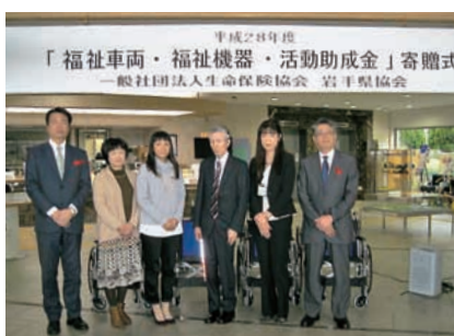
助成金受領団体の皆さん