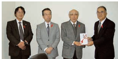
高橋代表取締役(右から2人目)

岩手県福祉基金では、寄付金を基本財産として積み立て、その運用益を県内の福祉活動への助成金に充てることとしています。