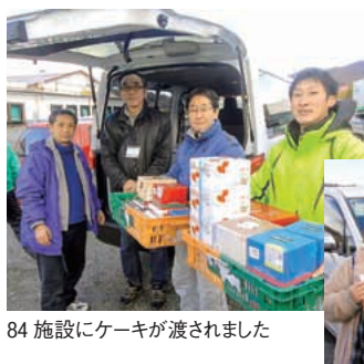
84 施設にケーキが渡されました