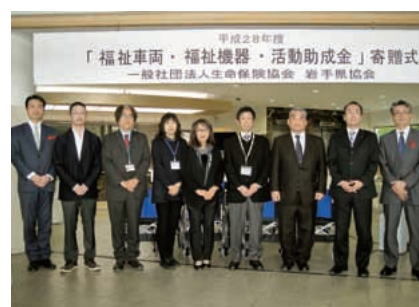
車いす受領団体の皆さん