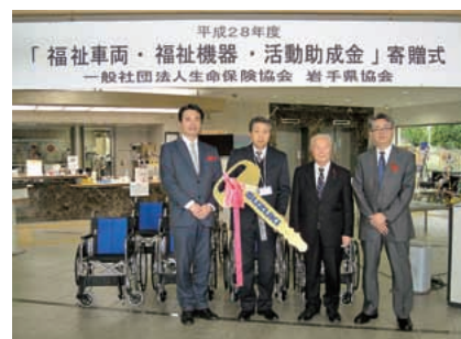
福祉巡回車両受領団体の皆さん