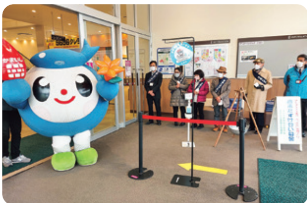
釜石市共同募金委員会