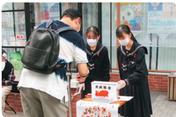
盛岡市共同募金委員会