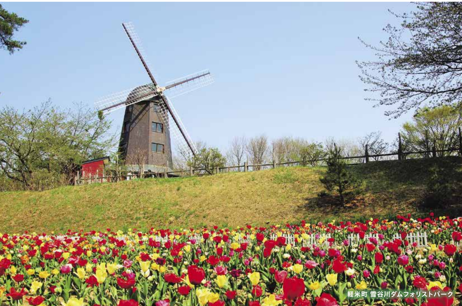
軽米町 雪谷川ダムフォリストパーク