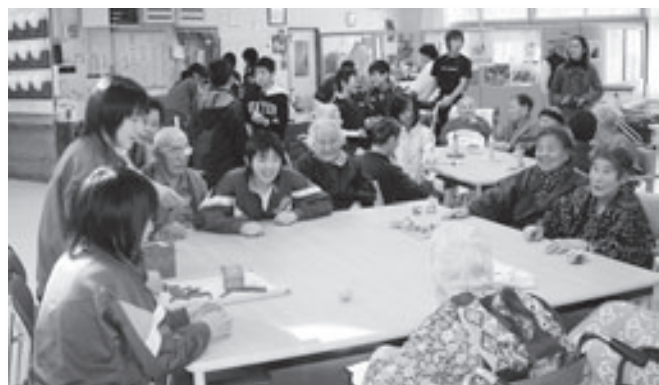
移動おもちゃ美術館「特別養護老人ホームにて」

学校、地域の指導者、ボランティア、民生委員、社協が手を取りながら活動しています。