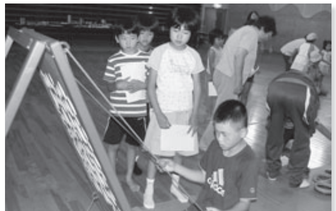
世界のおもちゃで遊ぶ会