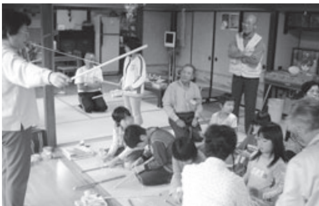
「土曜クラブ」手作りおもちゃ教室

今後も継続していくためには、スタッフ体制の強化や約束ごと、開催日変更等の周知徹底や確認を行い、より充実した運営を目指したいと思います。