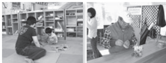
おもちゃ美術館って楽しい!

や子ども健全育成に何か出来ないものかと模索していた最中でした。「おもちゃ」を媒体として、児童だけでなく高齢者や障がい者のリハビリや多世代交流、地域交流の場にもつながっていくのではないかと考え、民生委員の考えに賛同し、ぜひ「おもちゃ美術館」を開館させたいと立ち上がったのです。