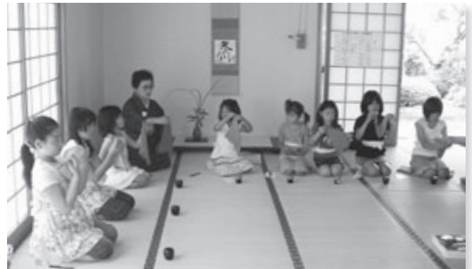
「土曜教室」茶道のお点前

開館してから5年目を迎えています。課題もあります。美術館は基本的に専門に管理する方がいないので、子どもが遊んだ後の後片付け等管理がなかなか難しいこと。