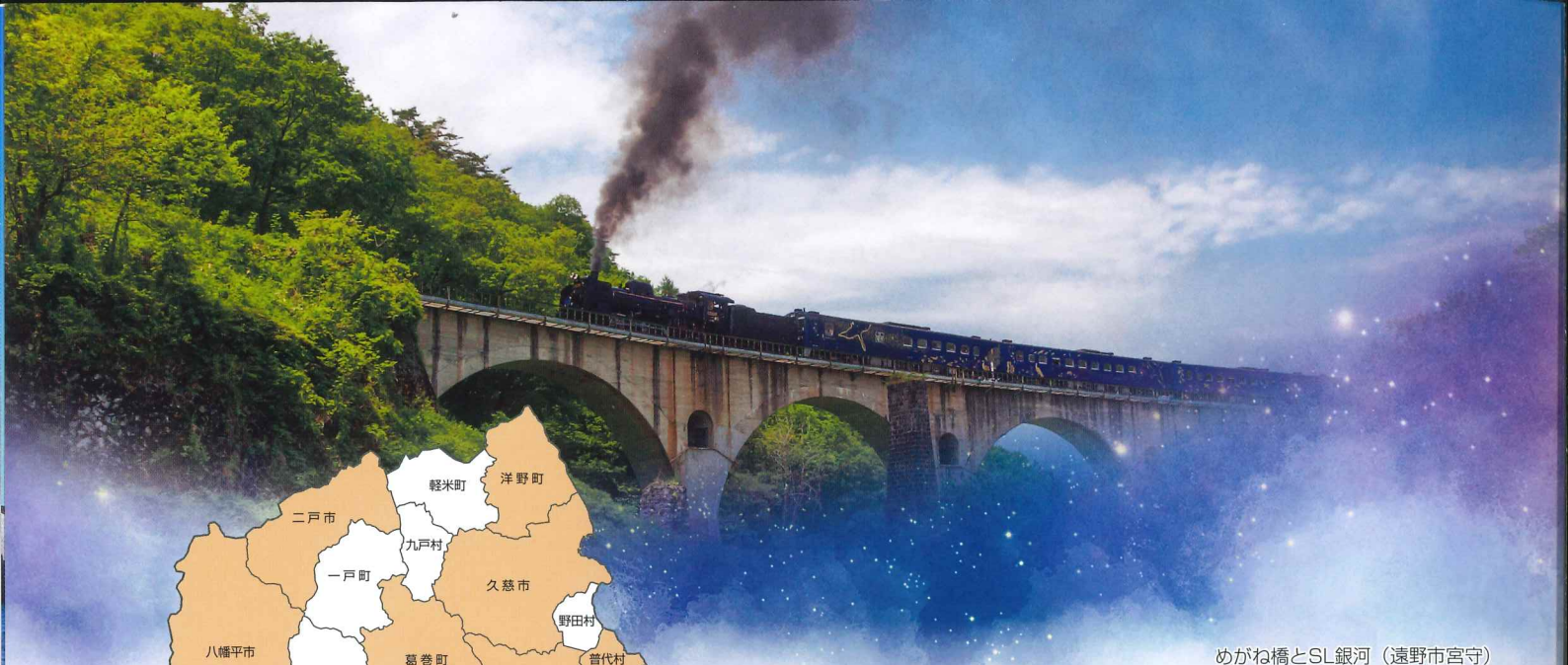
めがね橋とSL銀河（遠野市宮守）