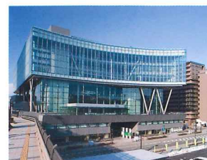
いわて県民情報交流センター 「アイーナ」

ホテルメトロポリタン盛岡「NEW WING」 〒020-0033 盛岡市盛岡駅前北通2番27号 TEL：019-625-1211