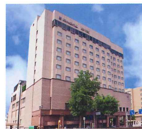
ホテルメトロポリタン盛岡 「NEW WING」