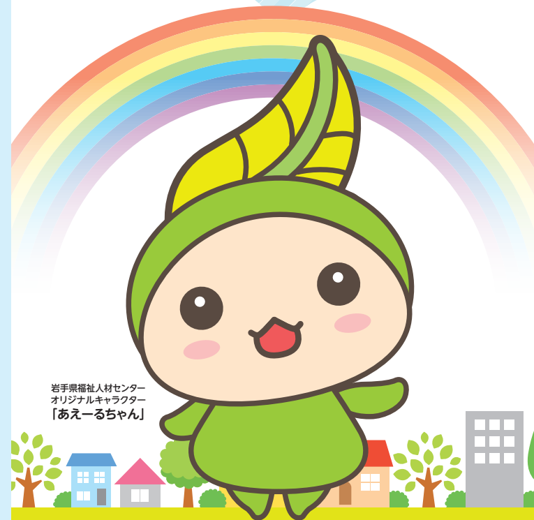
岩手県福祉人材センター オリジナルキャラクター 「あえーるちゃん」

いわてけんふくしじんざい 岩手県福祉人材センター (岩手県保育士・保育所支援センター)